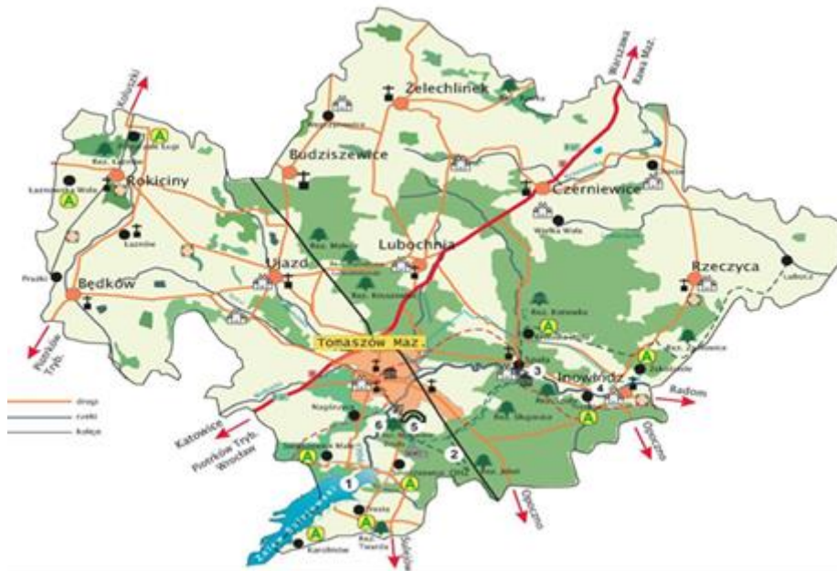
Rys. 3. Powiat tomaszowski.