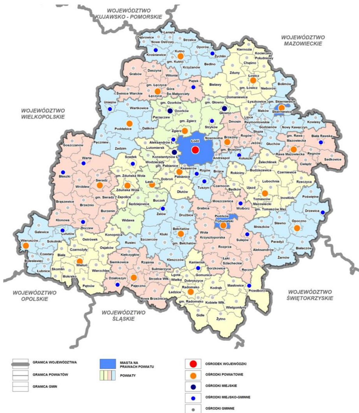
Rys. 1. Gminy i powiaty województwa łódzkiego.

Gmina Lubochnia to gmina wiejska położona w centralnej części powiatu tomaszowskiego, znajdująca się we wschodniej części województwa łódzkiego. Jest jedną z 10 gmin wiejskich tego powiatu, na który składa się ponadto gmina miejska Tomaszów Mazowiecki.