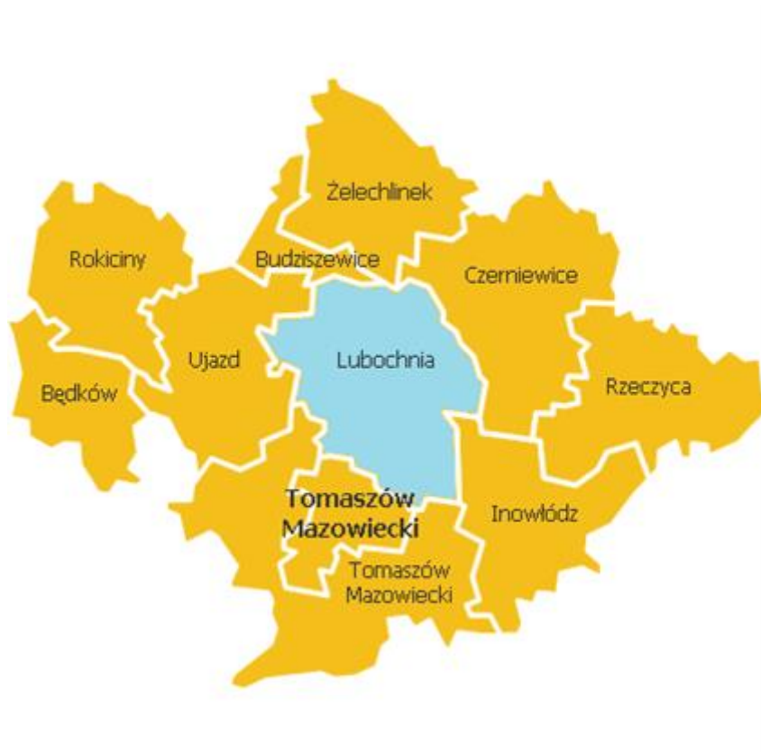
Rys. 2. Gminy powiatu tomaszowskiego.