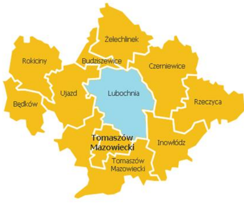
Rys. 2. Gminy powiatu tomaszowskiego.